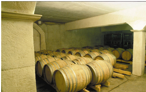
Høsten er i hus – og de bedste hygger sig på fad!