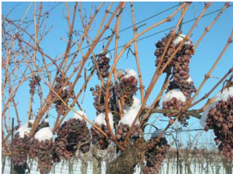
De sidste druer i 2004 har fået frost og sne – og er klar til høst!

Vintertid er også mørke dage og aftener, som inspirerer til indendørs aktiviteter, hygge og varme. Her er især rødvinen jo en dejlig "makker" – enten bare som et hyggeglas eller som ledsager til lækre vildt- og stegeretter sammen med bl.a. efterårets velsmagende grønsager.